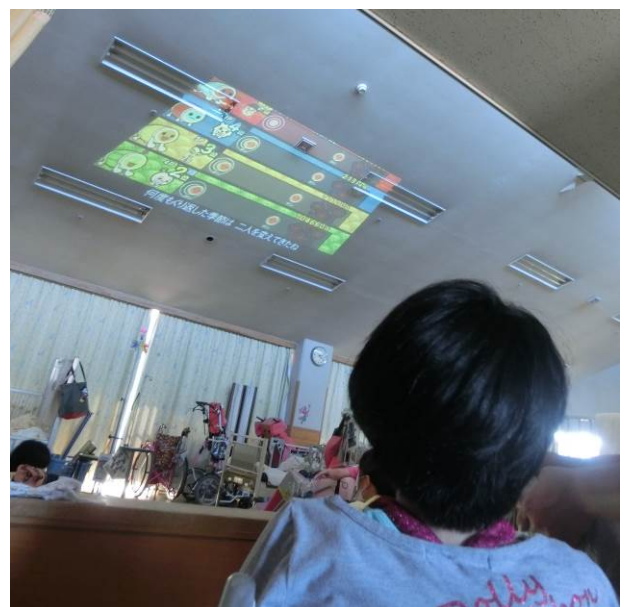
ジーッと見入っています！！

3病棟にはとても素敵な スクリーン があります。それは天井です。3病棟の天井は高く、少し斜めになっています。それを生かし、ピコピコ活動をする際に、天井に映像を映し、ゲームやDVDを見たり、 ipad を使い、 Youtube などを見て楽しむことができます。天井に映すことで視界が遮られず、セラピーに降りた状態でも、車椅子に乗った状態でも楽な姿勢で楽しむことができます。