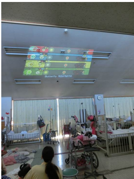
車椅子でも無理なく楽しめます

Youtube では利用者様おひとりおひとりの好きなものを選んで映すことができるので、童謡などの歌を聴いたり、アニメを見たり、乗り物を見たりなど様々な楽しみ方をすることができます。