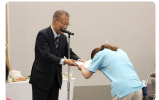
永年勤続表彰の様子