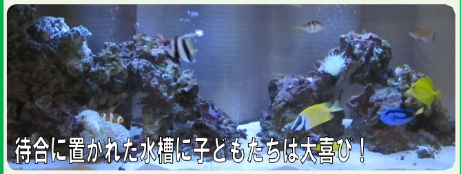
待合に置かれた水槽に子どもたちは大喜び!